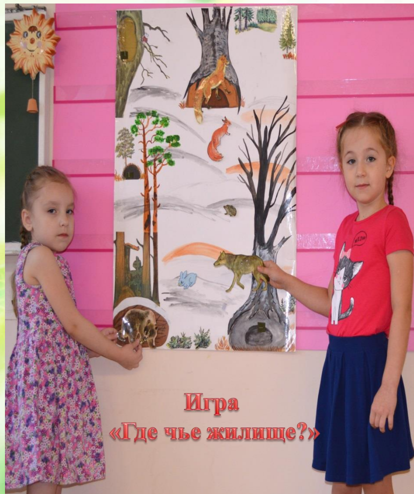
Игра «Где чье жилище?»

А чтобы нового больше узнать- решили свои мы игры создать.