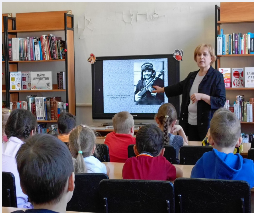
Ходили в библиотеку