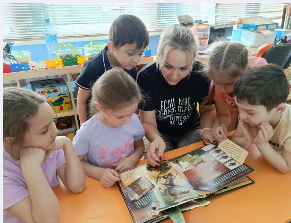
Искали информацию в книгах