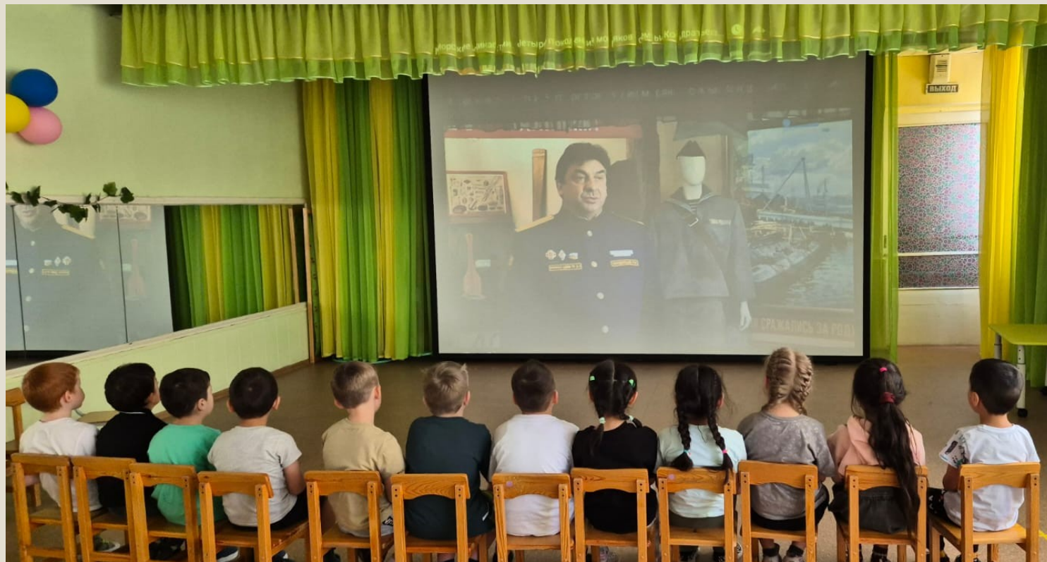
Смотрели познавательные видео

Он внедрял на судах новые навигационные приборы и методы, постоянно совершенствуя свои знания и умения.