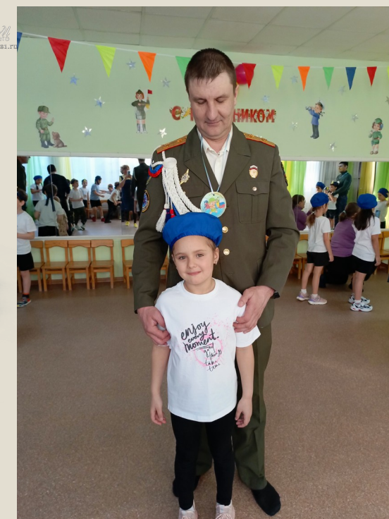
Общались с очевидцами