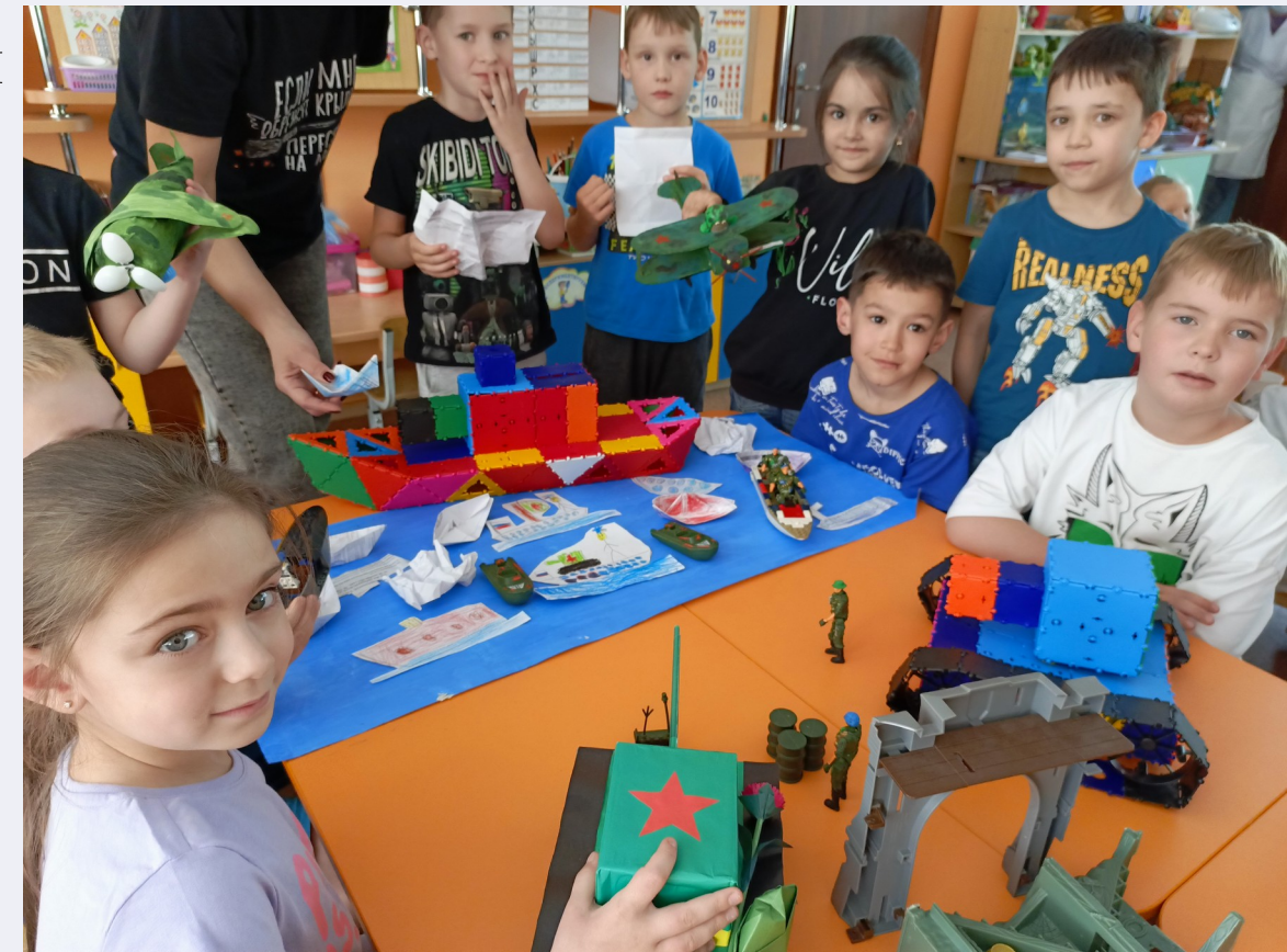
Играем, составили макет прибрежного боя